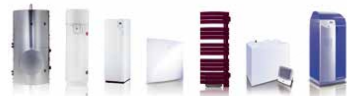
ПРОМИШЛЕНИ ВОДО-СЪДЪРЖАТЕЛИ УРЕДИ ЗА БИТОВА ГОРЕЩА ВОДА ТЕРМО ПОМПИ ЕЛЕКТРИЧЕСКО ОТОПЛЕНИЕ ОТОПЛЕНИЕ ЗА БАНЯ ВЕНТИЛАЦИЯ БИТОВИ И ИНДУСТРИАЛНИ КОНДЕНЗНИ КОТЛИ

Портфолиото на Atlantic включва най-разнообразен избор на уреди, отговарящи напълно на нуждите на потребителите.