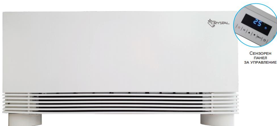
СЕНЗОРЕН ПАНЕЛ ЗА УПРАВЛЕНИЕ

(4) Конвекторите се предлагат в два варианта: L - хидравлични връзки от ляво и R - хидравлични връзки от дясно.